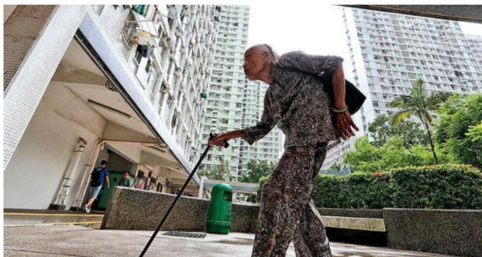
圖1之1 - 香港財務策劃師學會：疫情影響 退休人士平均每月支出僅11500元