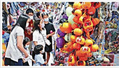
■父母可鼓勵小朋友自己儲錢，去買心儀的玩具。

英國保誠旗下的資產管理公司瀚亞投資針對來自亞洲9個國家、一萬名父母進行「親子理財」調查，了解父母們對理財教育的想法。當中，整體亞洲父母最在意「教導孩子的金錢價值」，接着是「孩子學習到如何做預算和存錢」，排第三的親子理財目標為「我的孩子知道要付出才能賺錢」及「孩子要能學習並分辨：想要與需要」，可見教小朋友儲蓄在亞洲父母心目中的理財教育舉足輕重。