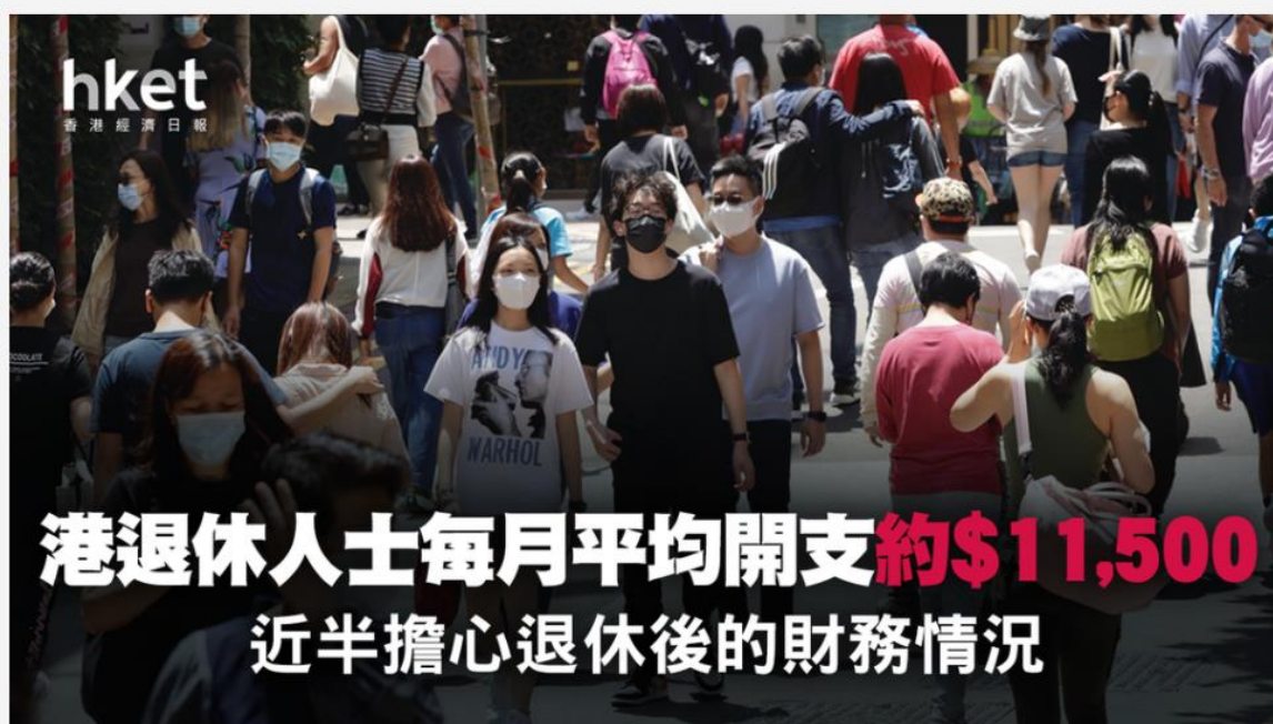
▲ 調查：港退休人士每月平均開支約$11,500 近半擔心退休後的財務情況

香港人壽命愈來愈長，有冇計過退休每個月要使幾多錢？香港財務策劃師學會公布「港人退休真實開支調查」，發現本港退休人士每月平均開支約為11,500元，交通及飲食為主要開支，女性支出較男性為多。