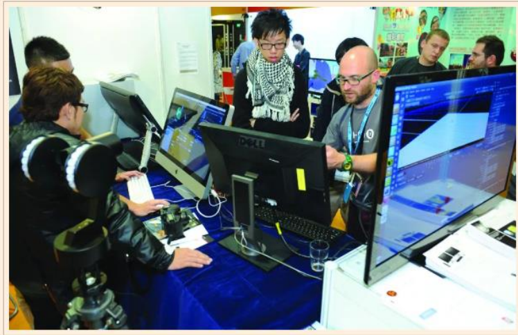
在新上位潮中，IT人才最吃香

在新上位潮中那些行業最受惠呢？以往資訊科技（簡稱IT）是厭惡性行業，惟拜移民潮及疫情居家辦公所賜，如今IT界求才若渴、挖角成風，分分鐘勝過金融才俊。