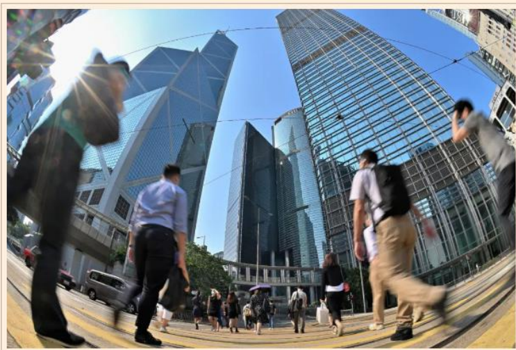
移民潮對留下來的港人而言，變相有更多和更大的工作機會，不但競爭減少，而且更易升職。

他透露，這幾名升職加薪的友人分別從事IT、銀行、金融等行業。其中一位原本月薪2.9萬元，升職後大幅加薪至4.2萬元，加薪升幅高達45%。本來需要由未婚妻作擔保人才可承造9成按揭，購入400至450萬元物業上車，現在以自己收入，便能承造9成按揭，購入490萬元或以下之物業，而選擇範圍更多，未來更打算讓未婚妻購入多一個物業作收租用途。