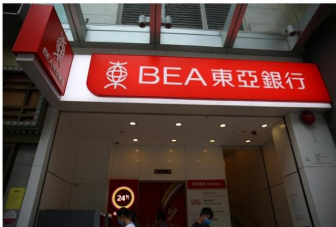
以借30萬元稅貸額，還款期為12個月來比較，提供最低實際年利率的為東亞銀行，利率為2.01厘。