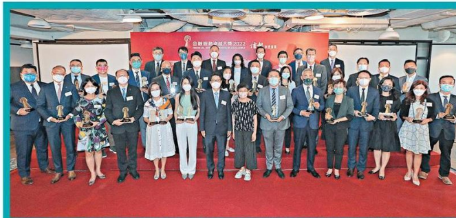
■信報「金融服務卓越大獎2022」頒發31項殊榮，財庫局副局長陳浩濂（前排左七）與主辦單位、評審委員、頒獎嘉賓及獲獎機構代表大合照。

除了傳統金融板塊外，政府亦着重為新興的金融板塊培養人才，包括「抗疫基金金融科技人才計劃」。其中2020年推出的在職金融從業員金融科技培訓計劃，共吸引逾1200名來自銀行、保險及證券業界的金融服務從業員參與。今年2月底再進行新一輪培訓