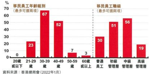
表一 BNO移英港人背景