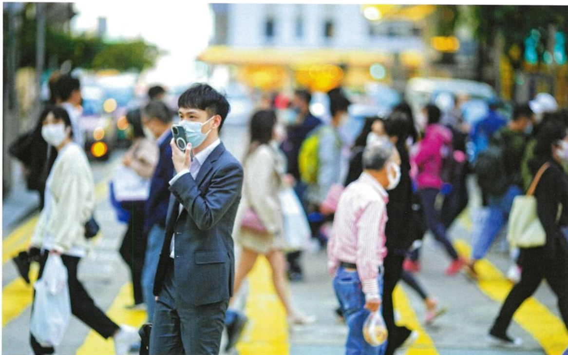
▲疫情肆虐、外資撤走等內憂外患下，現時年輕人上位機會其實比不上九十年代移民潮，且只集中在部分專業工作。

據他觀察，過去一年不少大學同學都頻繁「跳槽」、陸續上位；就連只有一兩年經驗的新鮮人，待遇亦由2萬倍增至4萬。「如果你 active 搵工，基本上LinkedIn的inbox就即刻有很多人message你。」