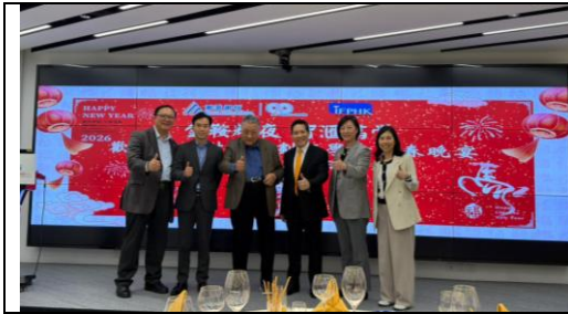
圖五：香港財務策劃師學會與澳門滙業銀行代表會面交流，氣氛融洽。