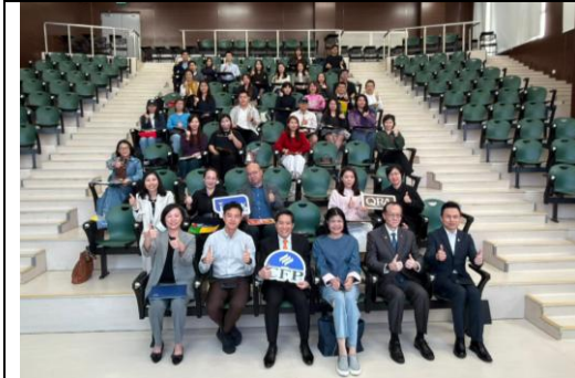
圖三：「財務策劃專業文憑及核准退休顧問課程導覽會」吸引近 50 人出席，現場反應熱烈。